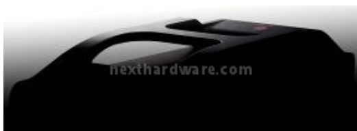
CM STORM - Scout

Nell'area dedicata a CM Storm, farà bella mostra di sé il nuovissimo gaming chassis Scout che saprà catturare gli sguardi di tutti gli appassionati videogiocatori ed gli amanti dei LAN-party.