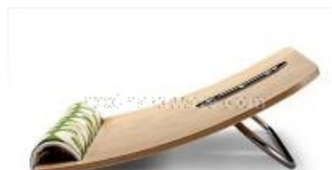
CHOIIX - Chair