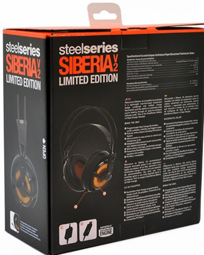
Sulla parte posteriore sono presenti le principali caratteristiche delle cuffie in quattro lingue, escluso l'italiano, e le relative specifiche tecniche.