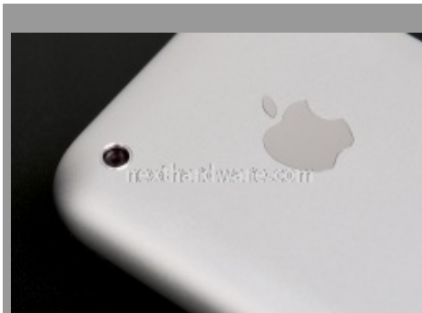
La piccola fotocamera posteriore.