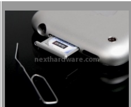
L'alloggiamento per la scheda SIM; da notare il sistema utilizzato per aprirlo...