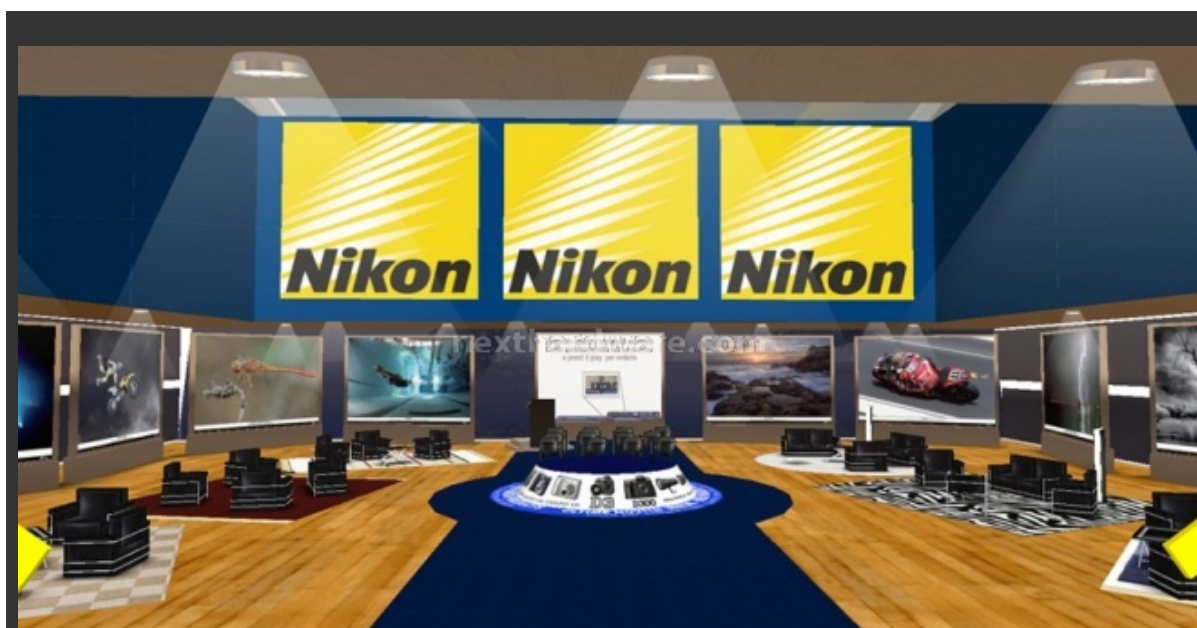
La hall circondata dalle fotografie del Photo Contest. Al centro l'espositore per i nuovi prodotti.