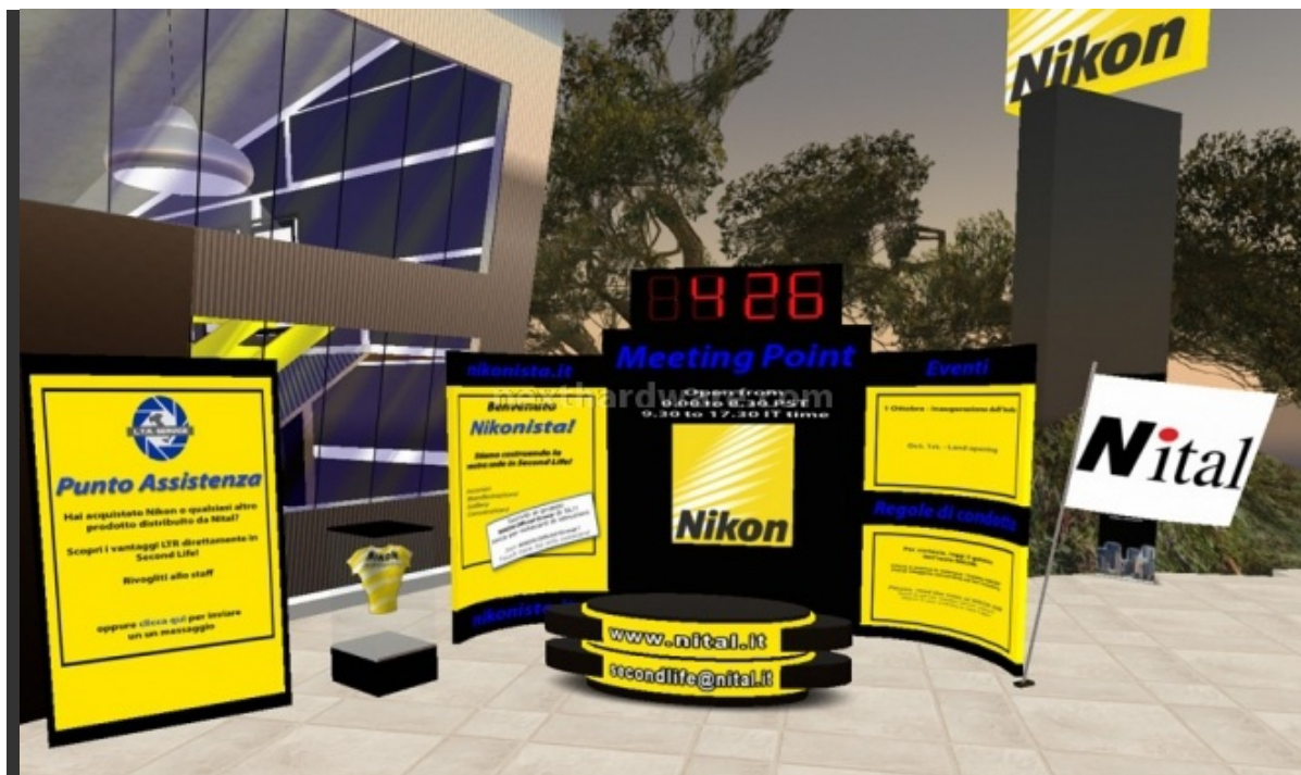
L'originale reception antistante l'ingresso principale.