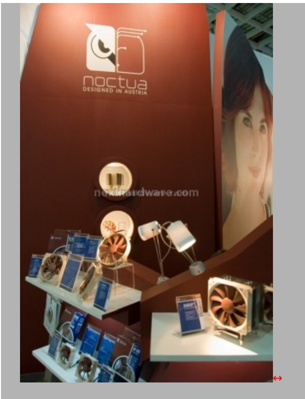
Alcune immagini dello stand Noctua