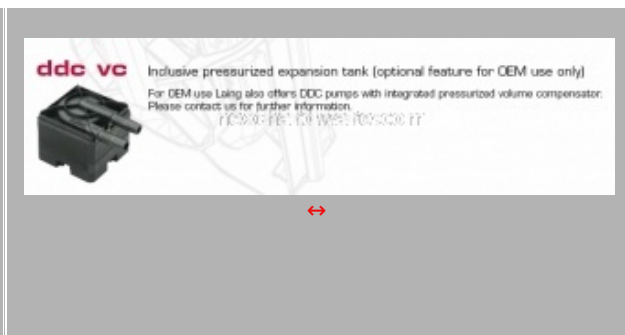
DDC VC con la pressurized expansion tank