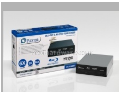
Il PX-B300SA, masterizzatore dvd e lettore blu-ray e HD-DVD

A tal riguardo Plextor ha da poco rinnovato l'intera serie di prodotti, affiancando ai classici masterizzatori dvd interni un masterizzatore combo (PX-B300SA) che permette di leggere supporti blu-ray e hd-dvd ed anche un masterizzatore blu-ray, il PX-B920SA. Infine, ricordiamo il masterizzatore cd dedicato principalmente agli audiofili, il PlexWriter Premium 2, dotato di tecnologia Yamaha's Audio Master Quality Recording system.