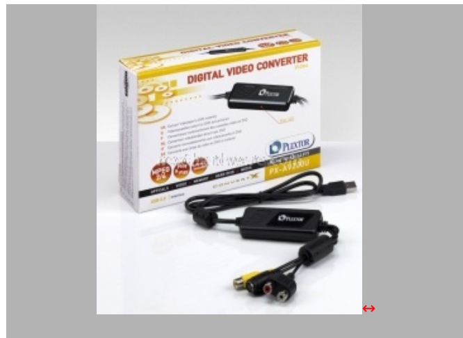
Il dongle usb PX-AV200U, che permette l'acquisizione di video analogico tramite connessione composito o s-video

La gamma dei Media Player e' composta principalmente da tre modelli.