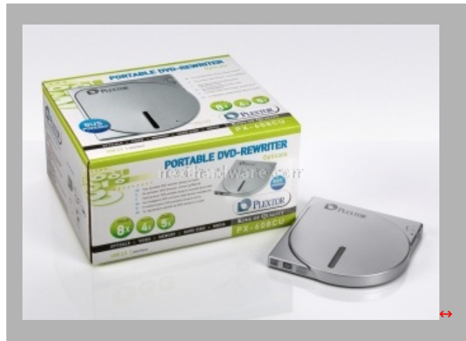
Il masterizzatore portatile PX-608CU, dal peso di soli 250 grammi

(250 gr), alimentato direttamente dalla porta usb.