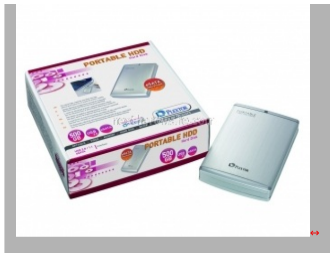
Il PX-PH500US, ultimo nato della famiglia di dischi da 2.5" con interfaccia e-sata

L'azienda prevede anche di introdurre, a breve, dischi da 1.8" in versioni da 80 e 160 giga, in questo caso con interfaccia usb-only.