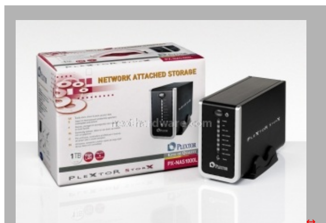
Il disco NAS PX-NAS1000L, versione intermedia da 1TB di spazio

Per quanto riguarda Network Attached Storage, Plextor propone un modello dotato di disco da 500GB,1TB o 1.5TB. L'unità, provvista di connessione GigaEthernet, offre anche due porte usb, alle quali collegare dispositivi usb per espandere le capacità del NAS, ed è dotata di funzionalità "Print Server".