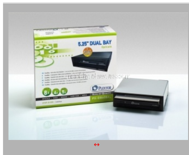
L'innovativo bay da 5.25" PX-DB608AL

Ultimo prodotto degno di nota, in quanto unico nel suo genere, e' il PX-DB608AL, un bay da 5.25" destinato a contenere due drive slim da portatili. Il bay, indicato principalmente per htpc di piccole dimensioni, viene offerto con uno slot occupato da un masterizzatore dvd.