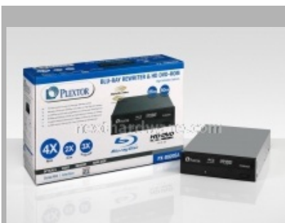
Il PX-B920SA, primo masterizzatore blu-ray di casa Plextor.