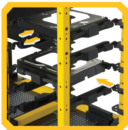
Il sistema di montaggio a sospensione AirMount™ per le unità a disco rigido elimina completamente le vibrazioni e consente di montare le unità in tre diverse direzioni

Ecco il nuovo LanBoy Air. Quasi tutti i componenti di questo case, inclusi gli attacchi per la scheda madre e per l'alimentatore, sono modulari e personalizzabili. Fino a un massimo di 15 ventole sono rivolte verso l'interno del case, per creare una pressione positiva che convoglia calore e sporcizia verso l'esterno, attraverso i pannelli perforati. Nella parte anteriore, le unità a disco rigido sono letteralmente sospese a mezz'aria grazie all'esclusivo sistema di montaggio AirMount™, che garantisce una resistenza insuperabile a vibrazioni e rumore. Dotato anche di due guide di fissaggio interne per unità a disco integrale SATA (SSD) da 2,5 pollici e di una porta USB 3.0 sul pannello frontale, questo modello garantisce una flessibilità di progettazione che non teme alcun confronto.