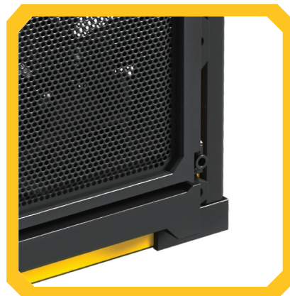
Le ventole a velocità variabile sono dotate di una manopola di regolazione senza scatti, per offrire una gamma praticamente infinita di impostazioni di raffreddamento